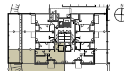
PLAN BUDYNKU B POZIOM 0